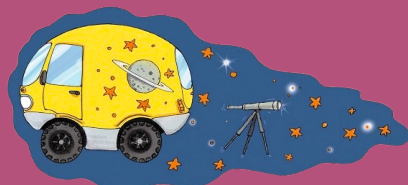
PLANETARIUM ON THE GO

Με τη συνοδεία τηλεσκοπικής παρατήρησης και πραγματικών μετεωριτών, μικροί και μεγάλοι θα αγγίξουν κυριολεκτικά τα αστέρια!